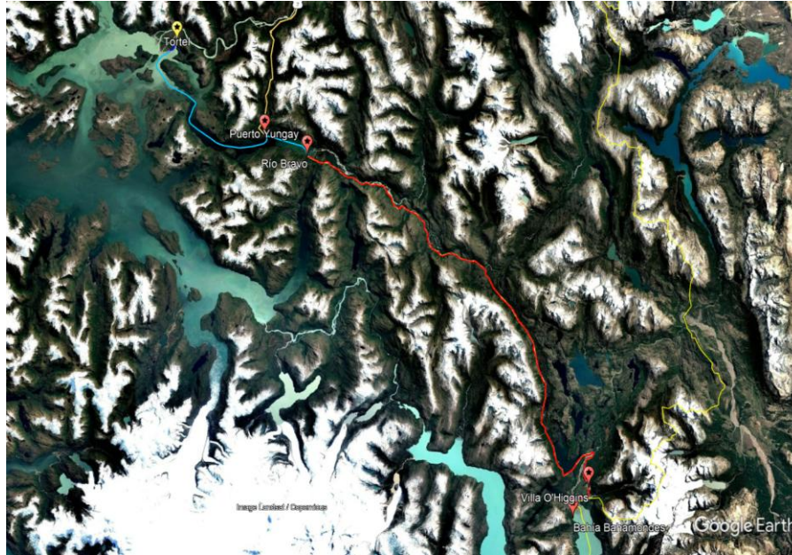
Ilustración 1: Tramo Regional de Infraestructura Óptica O'Higgins.

Para mayor información se puede visitar la página http://www.subtel.gob.cl/vohiggins2024/