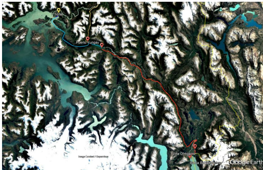
Ilustración 1: Tramo Regional de Infraestructura Óptica O'Higgins.

La Propuesta adjudicada compromete el tendido de más de 150 [km] de cable de fibra óptica de 48 filamentos, de los cuales aproximadamente 42 [km] corresponden a tendidos submarinos entre las localidades de Tortel, Puerto Yungay y Río Bravo. Estos tendidos —aéreos, soterrados, submarinos y para Situaciones Especiales— conectarán a los POIIT Terrestres comprometidos para las localidades de Bahía Bahamondes, Villa O'Higgins, Río Bravo y Puerto Yungay, los cuales terminan en el Punto de Terminación a ser instalado en la localidad de Caleta Tortel, en las cercanías de los POIIT Submarino y Terrestre en operación de los Proyectos Troncal Submarina Austral y Troncal Terrestre Aysén de los Concursos Fibra Óptica Austral. Los POIIT Terrestres dispondrán de todos los equipos, componentes y elementos necesarios para la provisión del Servicio de Infraestructura en los términos previstos en las Bases de Concurso, del mismo modo en que los TRIOT Terrestres dispondrán de todos los elementos y componentes para asegurar la performance óptica exigida y la debida operación del referido servicio.