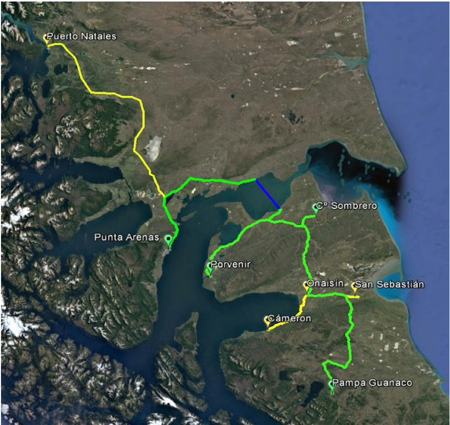
Ilustración 4 - Trazado FOA Magallanes - Conductividad Austral Ltda.

La solución técnica implementada por la Beneficiaria Conductividad Austral Ltda. para el Proyecto Troncal Terrestre Magallanes contempla la instalación de la totalidad de los Puntos de Operación e Interconexión de Infraestructura Óptica de Telecomunicaciones (POIIT) Terrestres definidos en las Bases de Concurso; esto es, en las localidades de Punta Arenas, Porvenir, Cerro Sombrero, Pampa Guanaco, Puerto Natales, Onaisín, Cameron y San Sebastián.