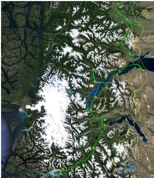
Ilustración 5 - Trazado Troncal Terrestre Aysén FOA

para la implementación de los TRIOT Terrestres que interconectan a dichos POIT Terrestres, los cuales fueron instalados con tendidos aéreos y soterrados, principalmente, en la faja fiscal de los caminos públicos de la región, además de instalarse tendidos subacuáticos en el Lago General Carrera.