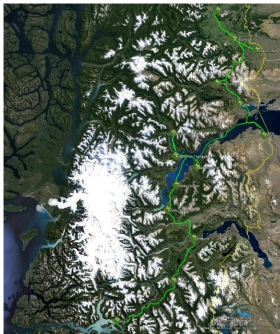
Ilustración 2 - Trazado Troncal Terrestre Aysén FOA

El Proyecto Troncal Terrestre Aysén contempla 14 POIT Terrestres emplazados en las localidades que se indican en la tabla siguiente, junto con el despliegue de más de 617 km de cable de fibra óptica para la implementación de los TRIOT Terrestres que interconectan a dichos POIT Terrestres, los cuales fueron instalados con tendidos aéreos y soterrados, principalmente, en la faja fiscal de los caminos públicos de la región, además de instalarse tendidos subacuáticos en el Lago General Carrera.