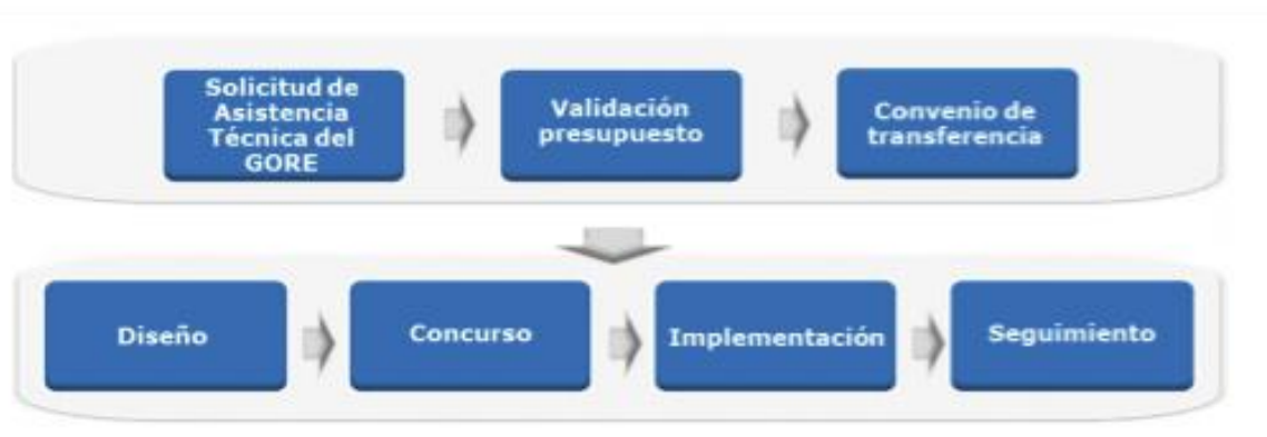
Diagrama del proceso:

Cabe señalar que, los proyectos de Última Milla, consideran soluciones en telecomunicaciones tales como telefonía móvil y datos, extensiones de fibra óptica e internet hogar.