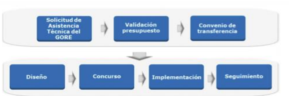
Diagrama del proceso:

Cabe señalar que, los proyectos de Última Milla, consideran soluciones en telecomunicaciones tales como telefonía móvil y datos, extensiones de fibra óptica e internet hogar.