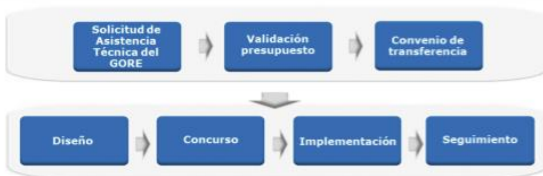
Diagrama del proceso:

Cabe señalar que, los proyectos de Última Milla, consideran soluciones en telecomunicaciones tales como telefonía móvil y datos, extensiones de fibra óptica e internet hogar.