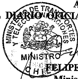
FELIPE MORANDÉ LAVÍN Ministro de Transportes y Telecomunicaciones

ANÓTESE, NOTIFÍQUESE Y PUBLÍQUESE EN EXTRACTO EN EL DIARIO OFICIAL.