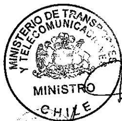
FELIPE MORANDÉ LAVÍN Ministro de Transportes y Telecomunicaciones

POR ORDEN DEL PRESIDENTE DE LA REPÚBLICA